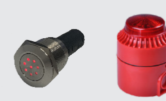
Unidad de Señalización

El panel de alarma compacto Audio-óptico TAP200 montado en el tablero para aplicaciones en vehículos, máquinas o embarcaciones. Cuenta con LED's "OK", "FALLO", "FUEGO", zumbador de alarma de incendio de 85dB, funcionamiento 9-36v, IP65, Ø50mm