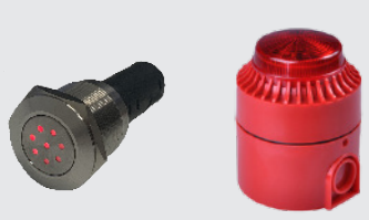
Unidad de Señalización

El panel de alarma compacto Audio-óptico TAP200 montado en el tablero para aplicaciones en vehículos, máquinas o embarcaciones. Cuenta con LED's "OK", "FALLO", "FUEGO", zumbador de alarma de incendio de 85dB, funcionamiento 9-36v, IP65, Ø50mm