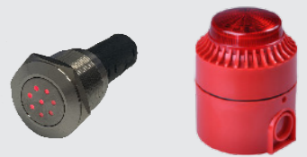
Unidad de Señalización

El panel de alarma compacto Audio-óptico TAP200 montado en el tablero para aplicaciones en vehículos, máquinas o embarcaciones. Cuenta con LED's "OK", "FALLO", "FUEGO", zumbador de alarma de incendio de 85dB, funcionamiento 9-36v, IP65, Ø50mm